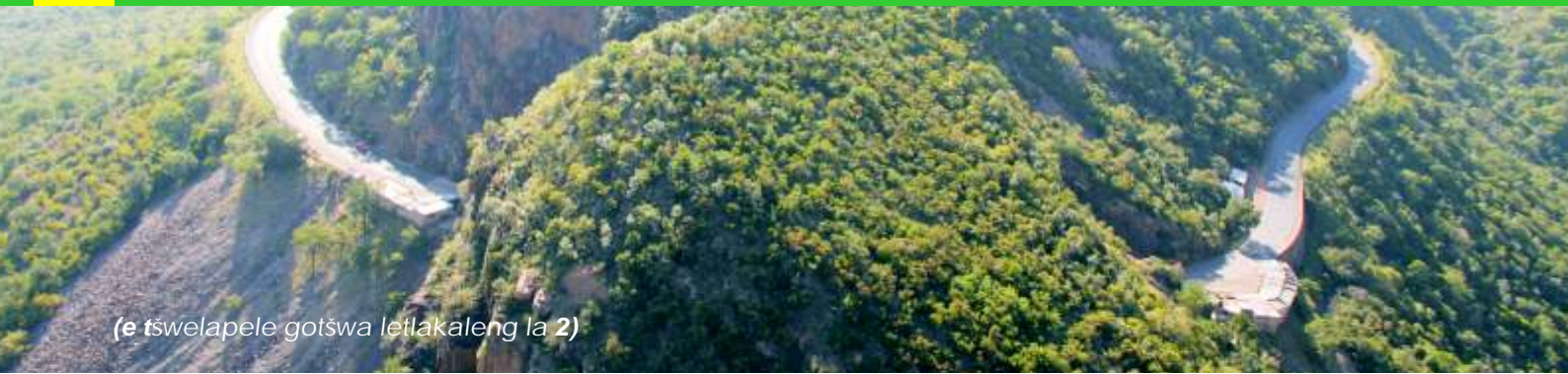
(e tšwelapele gotšwa letlakaleng la 2)

e šetše ele taba ya maloba gore lekgotlataolo la mellwane le rumile morero wa peakanyoleswa ya dikarolokgetho bjalo ka karolo ya maitukišetšo a dikgetho tša dipușoselegae tša 2016. Go bontšha se ese tlholompsa ka ge gotloga dikgethong tša nywaga ya 1995 go fihla ka 2000, go bile le phokotšo ya dipușoselegae go tloga go 843 go ya go 284, go bontšhwa gape gore se se tšwetše pele le ka 2000 go fihla ka 2006, fao phokotšo ye e tlogilego go 284 go fihla go 278. Ya se eme fao ka ge nywageng ya 2011 go fihla go 2016 re ikhwetša le palo ya dipușoselegae tše 267. Go itaeditše gore kgwekgwe go dipolelo le ditšhišinyo ka moka ke 'kgwatlhafalo' ya dipușoselegae gore di tšwetšephele kabko ya ditirelo.