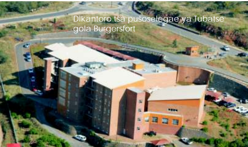
Dikantoro tša pușoselegae ya Tubatse gola Burgersfort