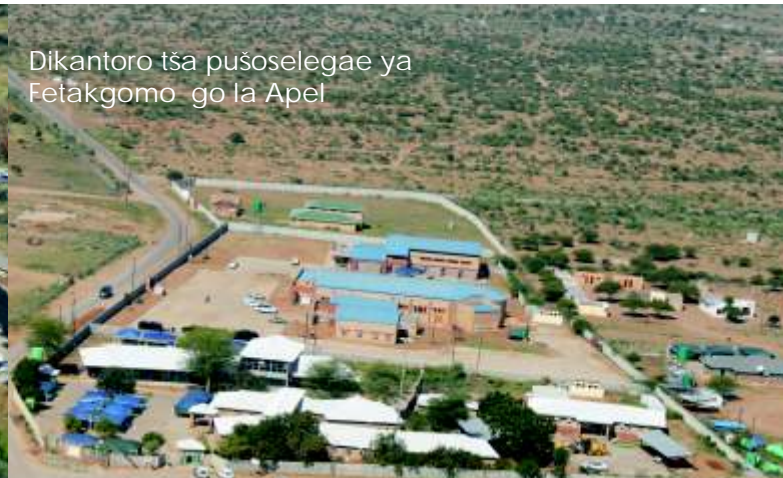
Dikantoro tša pușoselegae ya Fetakgomo go la Apel

Sehlophatšhomo sa setheotshepetšo se šetše se tsarogile phoka maitekelong a sona a kgonthišiša peakanyo ya tša setheo go akaretša dipușoselegae ka pedi. Ga bjalo bobedi bja dipușoselegae tše di na le dikomiti tša go šoma tša bolekudi, dintlha ka ga tšona dikomiti tše di filwe sehlophatšhomo go tsitsinkela le go ela mošomo wa tšona. Dikontraka tša Fetakgomo le Greater Tubatse di fela ka 31 Phatot 2016 le 31 Mopitlo 2017 ka tatelano.